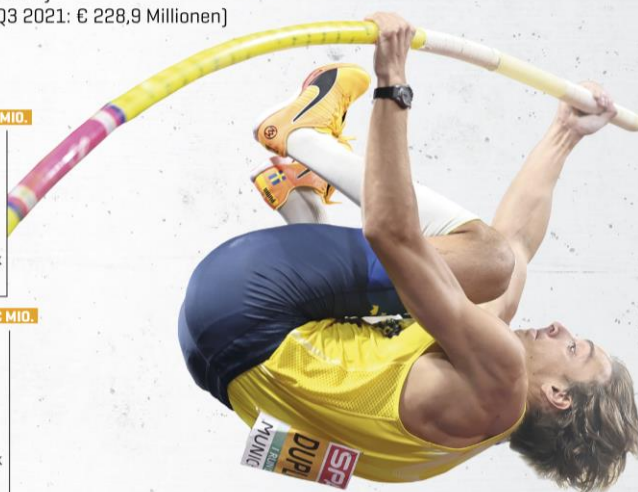
Weitrekordhalter im Stabhochsprung Armand „Mondo“ Duplantis.